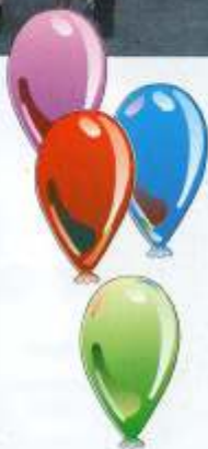
Peña "La Parpaja"