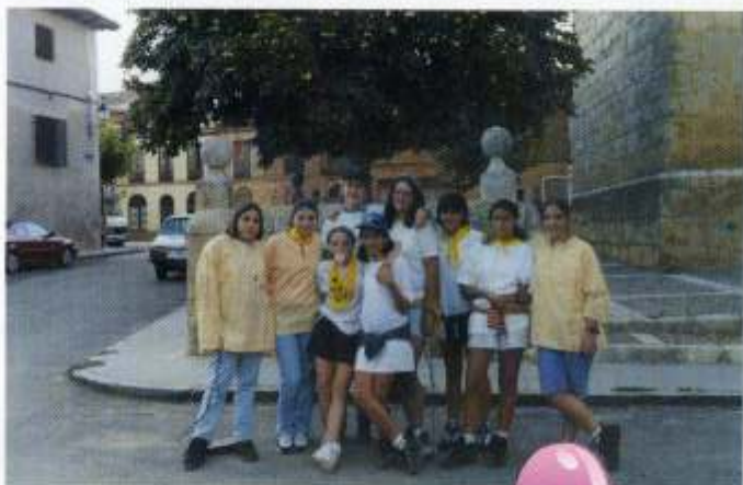
Peña "Toma y Daka"